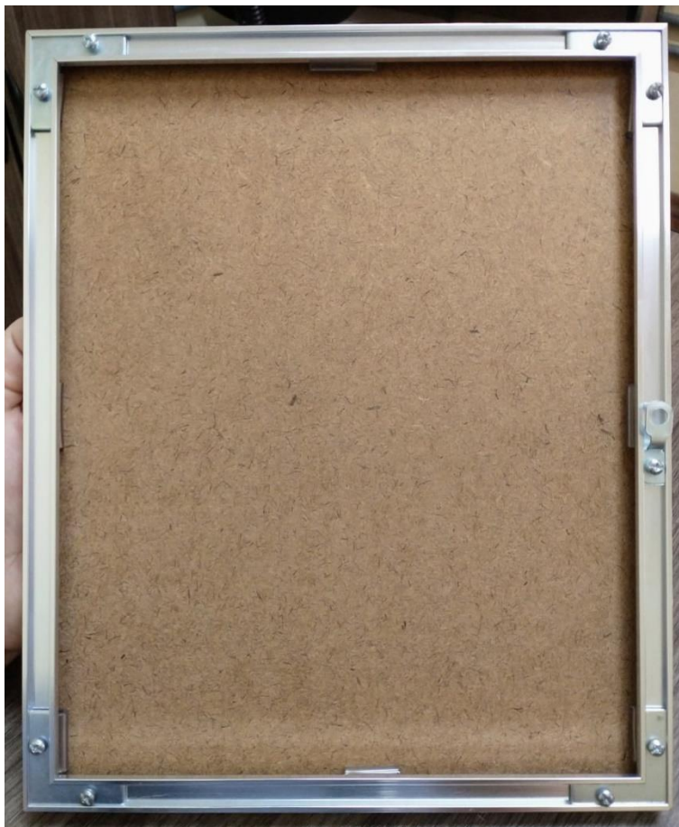
Verso da moldura em MDF ou outro material resistente