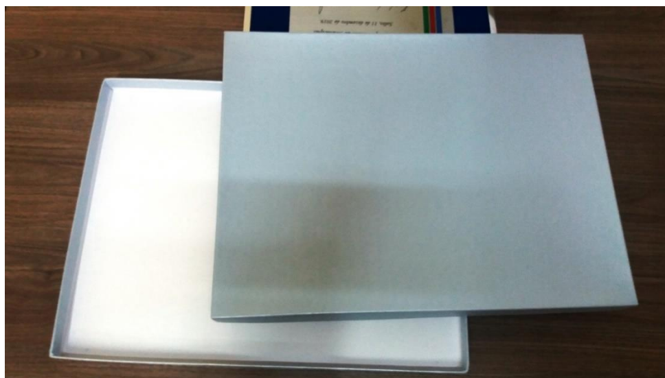
Caixa de papelão cartão rígido, medindo 32 cm x 42 cm, revestida de papel percalux na cor cinza prateado ou semelhante; e tampa feita do mesmo material da caixa